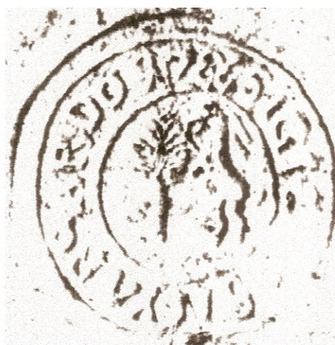
Pečať z roku 1786